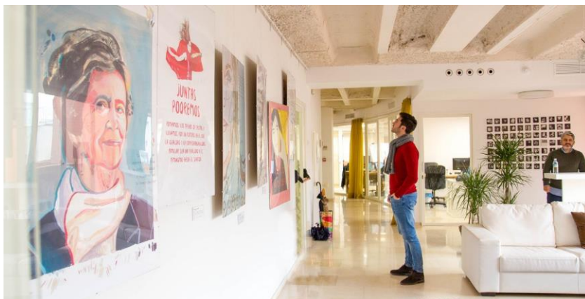
Espacio de hasta 1.000 m 2 cedidos para el desarrollo de las iniciativas de RES

Una gran familia formada por emprendedores, impulsores, pobladores e inversores que trabajamos en colaboración hacia la sostenibilidad económica de nuestros proyectos en particular y de la sociedad en general.